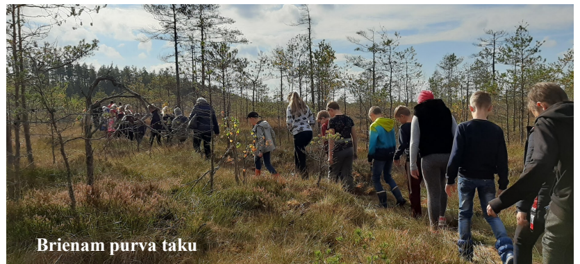
Brienam purva taku

Mūsu ceļš turpinājās uz Teiču dabas rezervātu—vienu no lielākajiem nes-